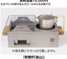
【野燐阿道山】 寄附金額100,000円