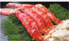
【ポイルタラバガニ800g(3Lサイズ)】 寄附金額14,000円

房総半島に位置する千葉県唯一の村、長生村。海岸一帯は県立九十九里自然公園内にあり、夏季には多くの海水浴客でにぎわいます。温暖な気候と平坦な地形を活用した稲作、野菜栽培が盛んで、九十九里浜での沿岸漁業により、豊富な海産物にも恵まれています。最近では、村の四季折々の風景を一年間かけて撮影し、一つの物語の中に収めた公式PR映画「長生ノスタルジア」が門真国際映画祭2020の観光映像部門で最優秀作品賞を獲得しました。