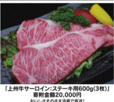
【上州牛サーロインステーキ用600g(3枚)】 寄附金額20,000円

玉村町は、四方を県内主要都市に囲まれベッドタウンとして成長した利便性の良いまちで、働き世代が多く活気あふれるまちです。米麦の二毛作を行い、特に麦が色づく5月下旬～6月上旬には黄金色に町が色づきます。また、関越自動車道・高崎玉村スマートインターチェンジに隣接の道の駅「玉村宿」は、観光・交流拠点として賑わいを増しています。当町に位置する群馬県食肉卸売市場から直売される上州牛、上州豚は絶品！お近くにお立ち寄りの際は、ぜひご来店をお願いします！