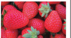
【山武産 甘熟いちご】 寄附金額10,000円

山武市(さんむし)は、九十九里浜のほぼ中央に位置し、交通の便にも恵まれて都心からアクセスできます。国際環境認証「ブルーフラッグ」を2年連続取得した本須賀海岸など、海水浴客でにぎわう海岸地帯。稲作はもちろん、イチゴやネギの生産が盛んである田園地帯、サンブギを活用した林産物の製造や関東ローマの土で育てられたニンジンや落花生の生産が盛んである丘陵地帯。海、田園、山、豊かな自然と巡る四季折々の恵みである特産品を、ぜひお楽しみください。また、2020年市区町村魅力ランキングで最下位にランキングされた山武市。ふるさと納税を通じて応援していただき、その魅力を全国のみなさまに知っていただきたいと思ひます。