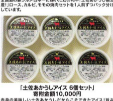
【土佐あかうしアイス 6個セット】 寄附金額10,000円