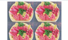
【土佐あかうし焼肉3種盛り(1人前)】 寄附金額30,000円

豊かな水は、町の基幹産業である農畜林を支えています。農業では、棚田の地形を活かした県下有数の良質米の産地です。畜産においては、高知県特有の和牛「土佐あかうし」の県下最大の産地であり、森林面積87%を有する林業の町でもあります。また、本町は、四国の水がめと言われている「早明浦ダム」を活用し、カヌーの拠点づくりを進めています。この町の誰もが、豊かな自然に恵まれたこの町で生まれ育ったことを人生の大きな喜びとできる、「ここにおって良かった」といえるふるさとづくりに全力で取り組んでいます。