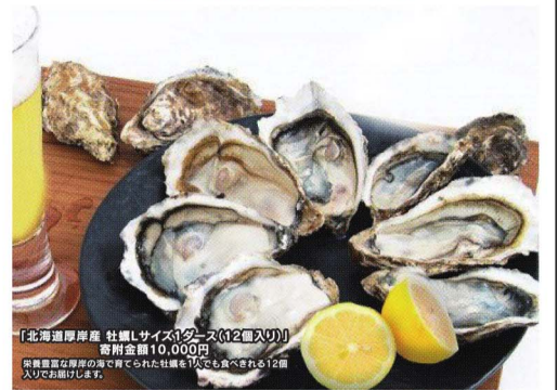
【北海道厚岸産 牡蠣(生)12個入り】 寄附金額10,000円

厚岸町は、アイヌ語で「アツケン」(牡蠣の漁場の意)から名前が来ていると言われているほどの牡蠣の町です。生牡蠣でも、焼き牡蠣でも、蒸し牡蠣でも美味しく頂ける厚岸の牡蠣を皆さまにぜひ味わっていただきたいと思ひます。牡蠣以外にもサンマ・うなぎなどの魚貝類や、牛乳・チーズなどの乳製品、「厚岸産物」公認の木製グッズセットなど様々な返礼品を揃えています。皆さまからいただいた寄附金は、子どもの医療費を高校生まで無料化や、保育所の遊具購入、地域産業や観光の振興などに使わせて頂いています。「誰もが住みよい・住みたくなる・来なくなる」ような、夢と誇りを持てる厚岸町を目指していきたくと思ひます。どうぞよろしくお願ひします。