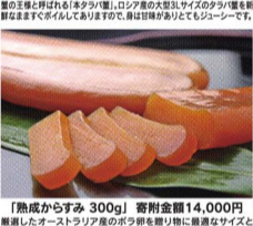
【熟成からすみ 300g】 寄附金額14,000円