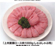
【上州豚ロース肉1000g(しゃぶしゃぶ用)】 寄附金額10,000円